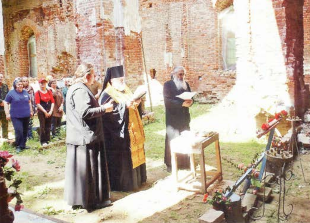
Молебен в стенах Сойкинской святыни возглавляет Владыка Назарий

Во время трудовой вахты, прошедшей в мае 2015 года, при расчистке прихрамовой территории был обнаружен хорошо сохранившийся каменный фундамент деревянной церкви 1726 года. Силами партнерства ведутся масштабные историко-архивные исследования и поиски. По причине того, что храм на долгое время оказался на режимной и хорошо охраняемой территории в связи со строительством в предвоенные годы крупнейшей на Балтике военно-морской базы «Ручьи», прозванной в народе «вторым Кронштадтом» и города Комсомольска-на-Балтике, документов о полуразрушенной церкви Николая Чудотворца практически не сохранилось. Были направлены запросы в различные государственные архивы. Ответы, полученные на запросы из Центрального государственного архива Санкт-Петербурга, были интересны, но не содержали ни изображений, ни фотографий, ни чертежей храма. Тем ценней было получить в ответ на запрос в Институт материальной культуры РАН фотографию деревянного храма 1726 года, его алтаря и даже церковной утвари.