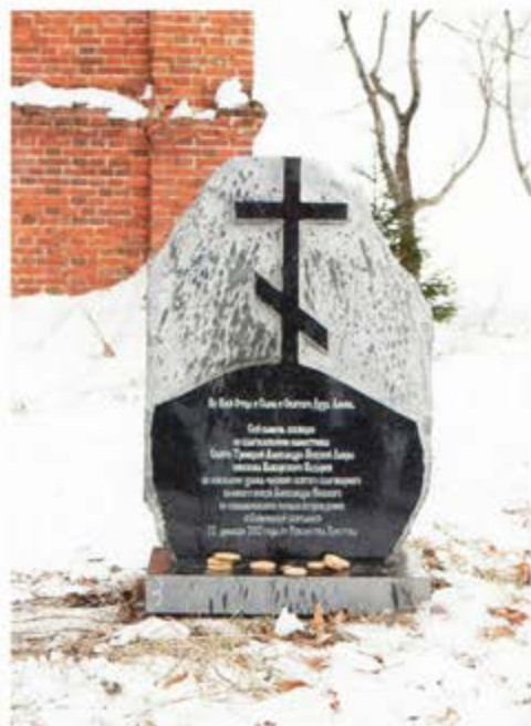
Освящение закладного камня Часовни свт. бог. кн. А. Невского