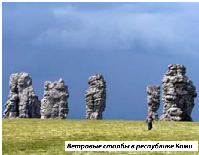
Ветровые столбы в республике Коми

Наряду с государственными музеями-заповедниками государство создало и государственные природные заказники – территории (акватории), имеющие особое значение для сохранения или восстановления природных комплексов и их компонентов и поддержания экологического баланса. Государственные природные заказники могут иметь различный профиль, в том числе быть комплексными (ландшафтными), предназначенными для сохранения и восстановления природных комплексов (природных ландшафтов).